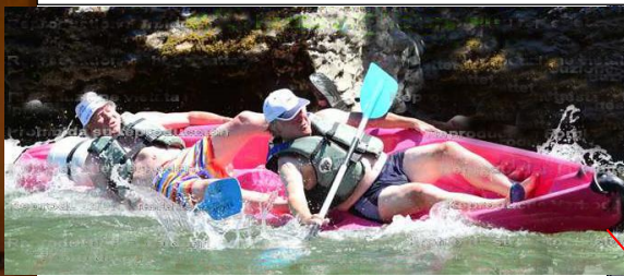
„155 Jahre Laien!“ im Kanu auf der Ardeche - ohne zu kentern.